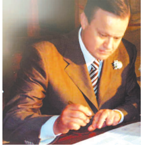
Ібо какал польза человеку, если он приобретет весь мир, а душе своей повредит? (Матф. 8:36)

В России и в большинстве стран мира набирает скорость инфляция. Это видно невооруженным глазом и тревожит многих. Инфляция часто подается как неизбежное и неуправляемое явление. Но не могут цены сами по себе расти, как лишь только в головах людей, придерживающихся теории прибыли. Инфляция сама по себе это понятие ментальное, но реализующее себя в экономических категориях в системе прибыли. У И. В. Сталина в СССР и у Хьяльмара Шахта в Германии цены падали вниз.